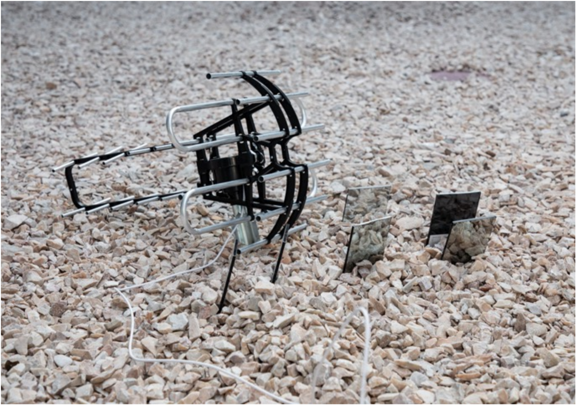
Installation view; Mariela Gutiérrez, Chac Chel Rising , 2019